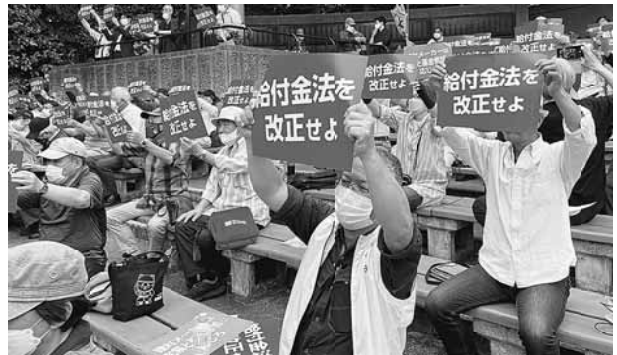
1500人の仲間が結集した建設アスベスト大集会。日比谷野音、5月20日