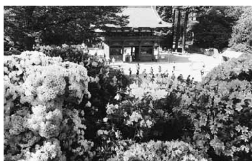
【吉田敬子通信員】東尾久2分会】4月25日に文京区の根津神社に行きました。根津神社は、1900年