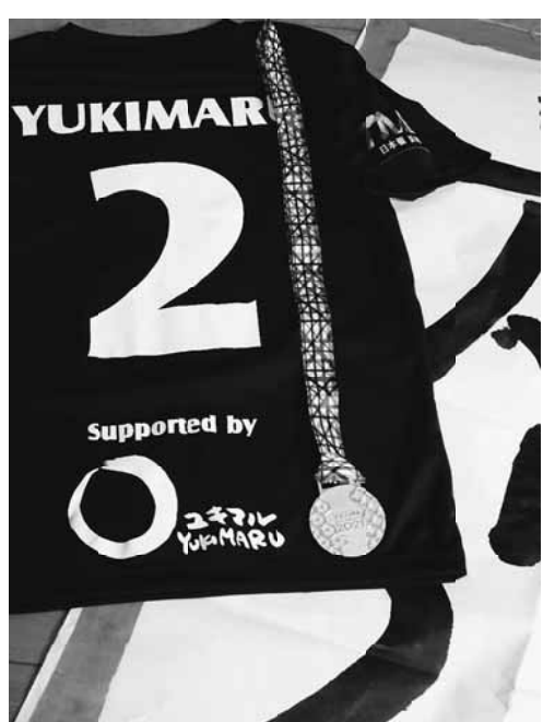
店の常連客からプレゼントされたTシャツ

減り時間があつたため家族の見舞いへ。帰る道々、「仕事にならない、お客さんに会えない」という想いから、「走りたい」と思うようになりました。 力とコツの介護の仕事と同じ もともと介護の仕事も力とコツが必要だったわけで、見舞いの帰りに走って練習をしていたのかも知れません。 コロナ禍でなければ、マラソン参加者は3万人以上ですが、今回は1万9千