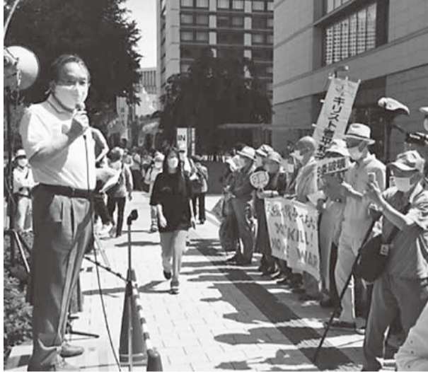
約800人が参加した総がかり行動の様子

【増山國吉記者 川西尾久分會】総がかり行動実行委員と9条改憲NO!全国市民アクションが6月19日、衆議院会館前で憲法を無視して戦争する国づくりを進める岸田政権に抗議し、参院選で政治を変えようとアピールする行動に取り組みました。行動には約800人が参加し、支部から3人が参加しました。