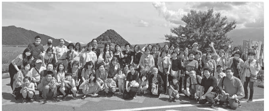
さくらんぼ狩りに参加した皆さん

な物が販売していません。(ハーブの化粧水はアトピーなどの肌の問題に、ブルーベリードリンクは飛蚊症に効果があると