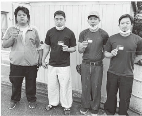
CCUSを取得した従業員の皆さん

特に大きい取引先だと仕事の話の前に「CCUSをもっていますか?」と必ず聞かれ、そこで「持っていない」と答