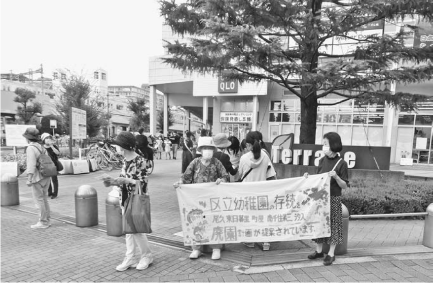
チラシ配りや署名活動を行う様子

なお、令和4年度に行う園児募集時(令和5年度入園児)から募集要項等に再配置に関する事項を明記し、周知を行う。