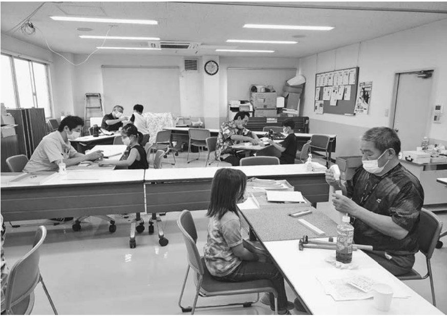
真剣に取り組む参加者の様子

で、プラスチックで作った女の子に「何を入れるの」と聞いたら「大切な物を入れます」とすごく嬉しそうでした。