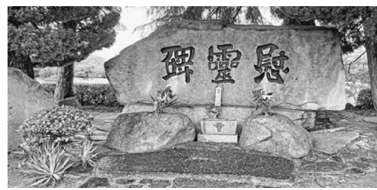
戦死者を弔う慰霊碑

原水爆禁止世界大会に参加させていただき、本当にいい経験をさせていただきました。ありがとうございました。