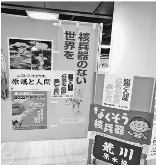
当時の凄惨な状況が分かる たくさんのパネルや資料