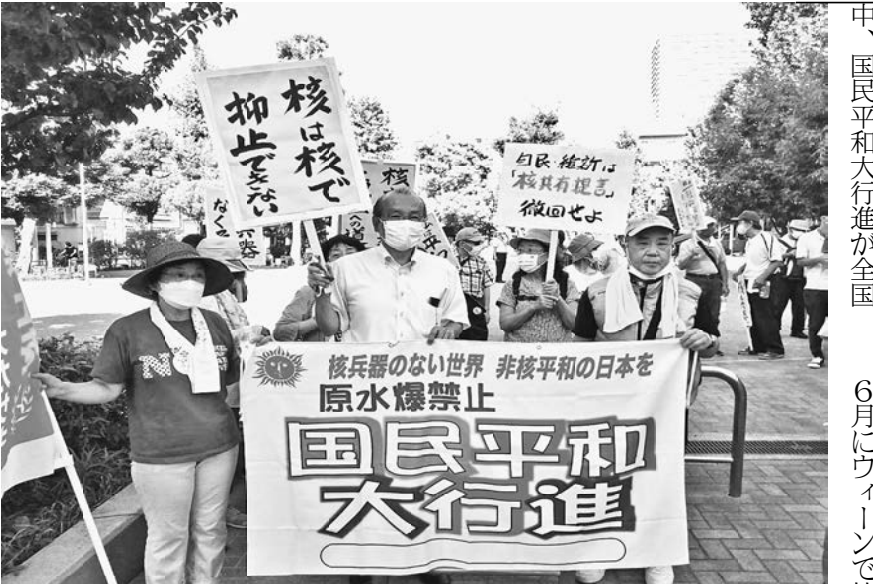
当日は酷暑下の大行進

【増山國吉通信員Ⅱ西尾久分会】7月28日、酷暑の中、国民平和行進が全国各地で行われました。行進のコースは荒川公園から入谷南公園までの約6キロで、新日本婦人の会荒川支部や年金者組合荒川支部などの他団体を含め、全体の参加人数は17人、支部からは7人が参加しました。 核兵器のない平和で公正な世界を求めて、毎年8月に広島、長崎をめざし、全国で行進、行動する原水爆禁止国民平和行進です。入谷の公園で台東支部の仲間と平和行進の旗をつないで渡しました。 ロシアがウクライナに対して軍事侵攻を開始し、一般市民や子供、学校や病院への無差別攻撃が現在も続いています。これは国際人道法違反で重大な犯罪です。 6月にウィーンで核兵器禁止条約の第一回締約国会議が開催されましたが、日本はオブザーバー参加すらしていませんでした。唯一の被爆国である日本からも声を上げ、ロシアの軍事行動を止めさせて撤退させましよう。