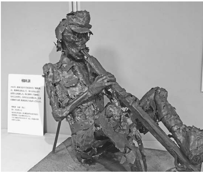
「戦陣訓」に従い自決する兵士の様子