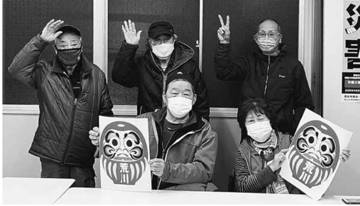
仲間つながりで拡大達成

【橋本良太II書記局】今回の秋の拡大行動が初の拡大のため、至らない点もあったと思いますが組合員さんのご協力のおかげで無事に荒川分会として目標を達成することが出来ました。