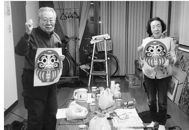
少数精鋭で拡大達成

いつも拡大行動の度に活動参加者の少なさに悩まされています。今年6人の加入目標で望みました。春は事業所の新入社員なども期待できますが、秋の日暮里2分会の