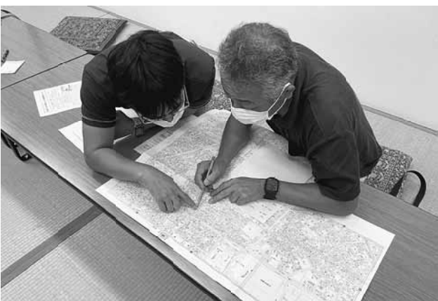
しっかり計画を練って拡大達成

この秋の拡大は、組合員訪問と未加入事業所訪問を中心に町屋地域を南北問わず訪問し、組合