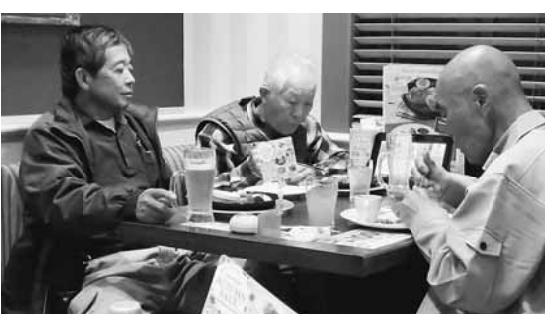
拡大達成後の打ち上げの様子

未加入拡大行動では、地域に根ざした拡大での飛び込みが主となっております。コロナ対策や木材不足等で工事の目途が立たないなどの話を切っ掛けに、つながりを持ちます。まずは、東京土建を知っていただくため、パンフ投函から始まり、会って話をするまでに時間がかかります。日曜日は会社は休みですが、1階が作業場で2階や3階が住まいだと、話をする機会が生まれます。今回の拡大では未加入対象者から2人が加入に繋がりました。行動をしないと分からない現実もありま