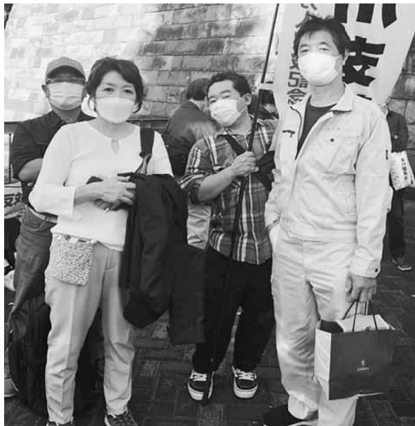
支部から参加した皆さん

集会は始めに主催者のあいさつがあり、その後各自のスピーチへと移りました。フォーラム平和・人権・