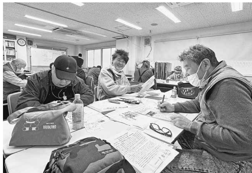
三者三様の「ヒグラシサト」を作りました

まずは、分會新聞のひな形づくりから行いましたが、普段使用しているソフトと使用の方が全く違うため、苦労しました。