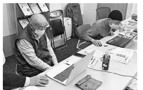
パソコン新聞づくり教室の様子

まずは、分會新聞のひな形づくりから行いましたが、普段使用しているソフトと使用の方が全く違うため、苦労しました。