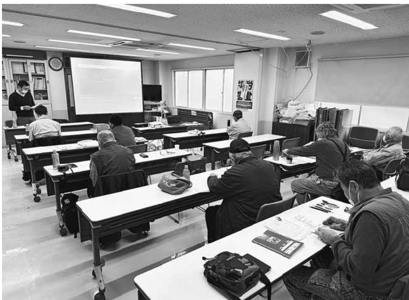
初心に帰って新聞づくりの基礎から教わりました

11月20日、支部会館3階で、教宣主催の機関紙づくり学習会を行いました。始めに本部の吉川専従常任中執を講師に、記事のレイアウトや見出しのつけ方、魅力的な文章の書き方など新聞づくりのポイントについての学習を1時間程度行いました。その後分會ごとに分かれ新聞づくりに取り組み、最後に総評を行いました。当日はあいにくの雨でしたが、10人が参加しました。また、11月25日に学習会参加者の要望で分會新聞づくり教室も開催し、2人が参加しました。