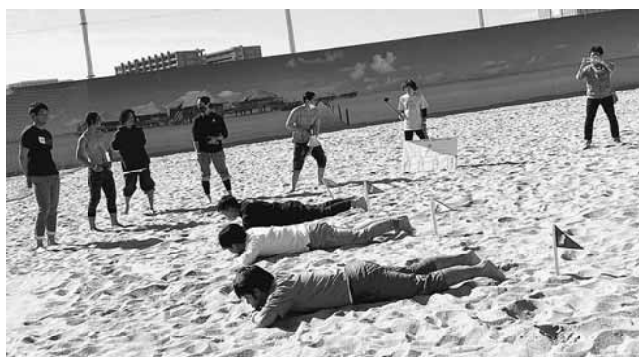
ビーチフラッグは惜しくも決勝戦敗退となりました

12月には東部ブロック合同で屋形船イベントの開催も予定しています。今後、他支部の青年部とも交流を深めていきながら、部員さんに楽しいと思ってもらえるような荒川支部青年部を目指していきます。