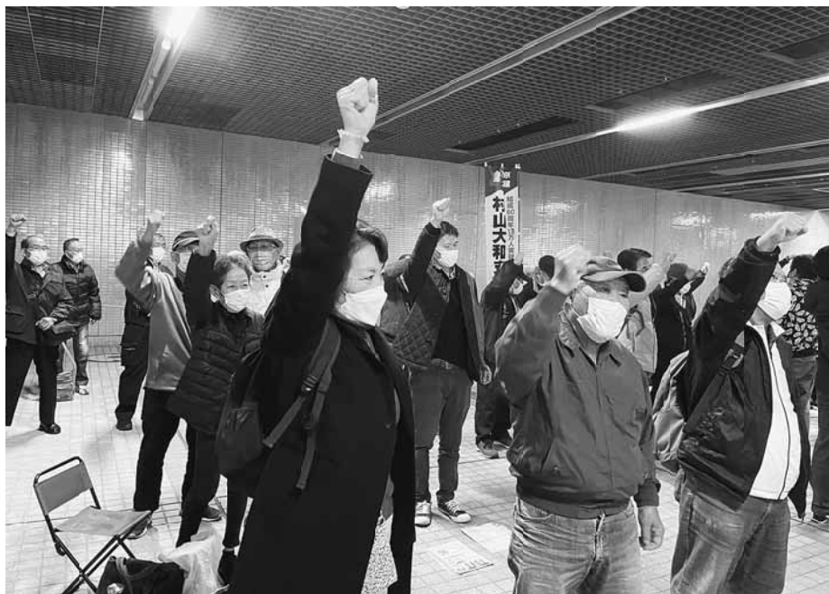
仲間の暮らしを守るために皆で団結ガンパロー