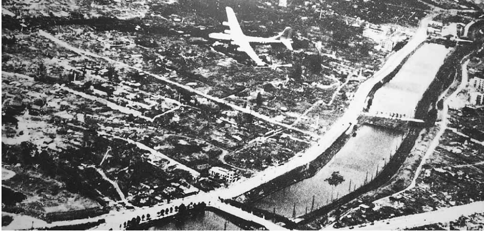
飛来するB29 肉眼で人が見えた