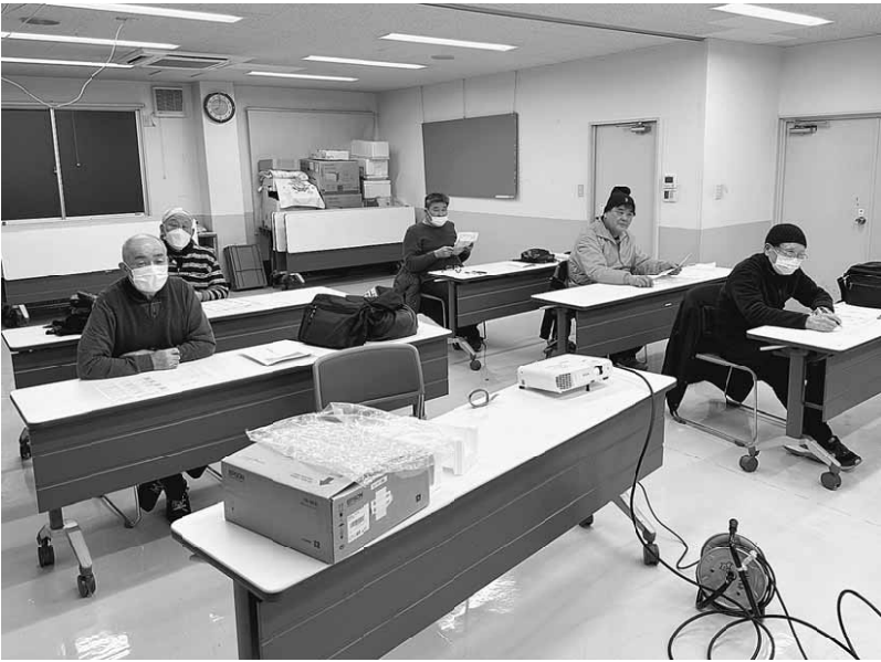
新聞づくりに必要なことをたくさん学びました

インターネットなどに自分で作った文章や写真などの情報を載せている人も多いため、その情報の権利を著作権と言いますが、著作権法で守られています。今まで耳にしてはいましたが、今こ