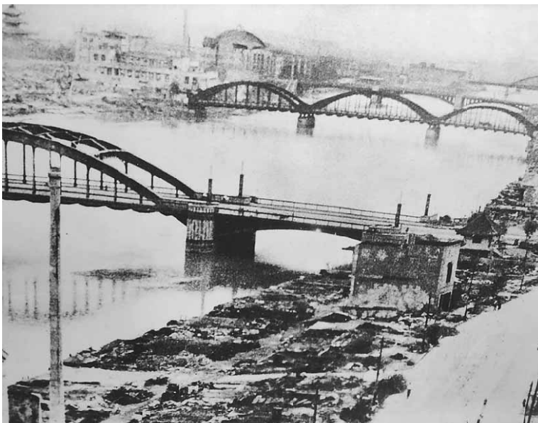
吾妻橋方面から見た本所方面

●義勇兵役法（要約・抜粋） 第2条 「年齢15歳以上、60歳以下の男子および、17歳以上、40歳以下の女子に義勇兵役を課し、必要に