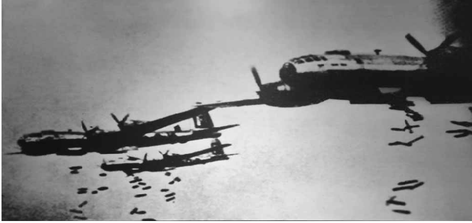
焼夷弾をばら撒くB29