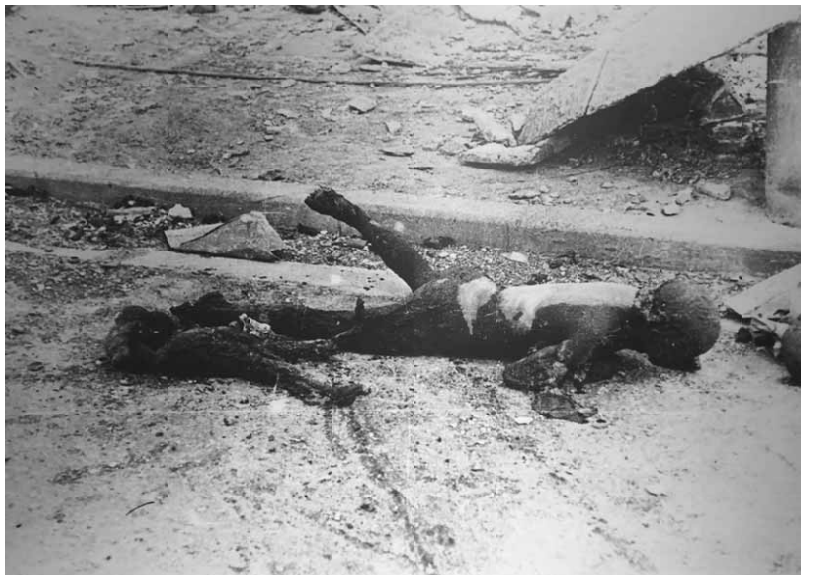
東京大空襲の死者・母が子どもを背負って倒れ、後に背負紐が焼けきれた様子