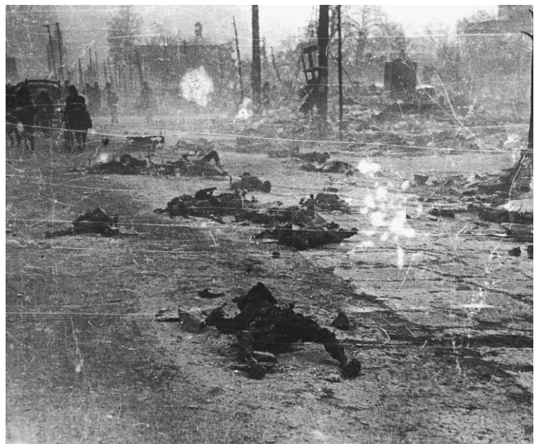
劫火(こうか)の犠牲となった台東区浅草花川戸の焼死体