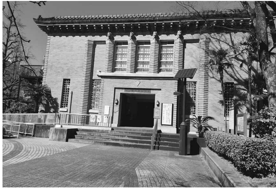
東京都復興記念館