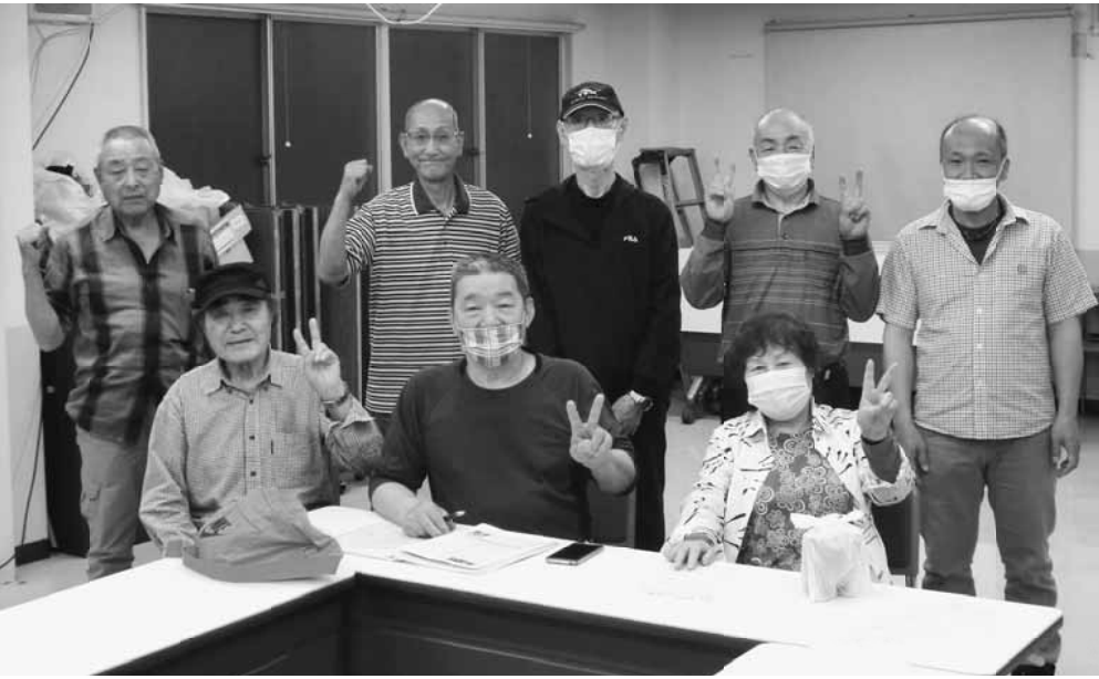
皆で力を合わせて頑張りました