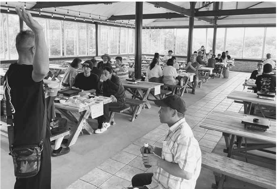
広々とした会場をゆったり使ってBBQが出来ました

せっかく順調に牛込海岸に到着出来たのに、初動のミスで潮干狩りがまともに出来ないのではないかと青ざめていたところ、行列が