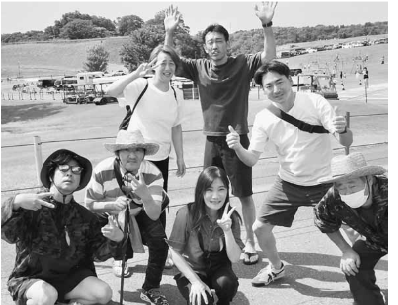
BBQ後は村内でそれぞれで楽しみました。

バタバタしながら潮干狩りを終え、11時30分頃より東京ドイツ村へバスで移動、12時過ぎにバーベキューの昼食となりました。