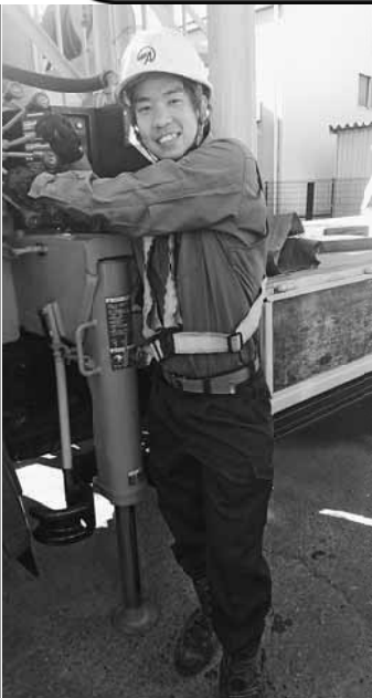
仕事にも少し慣れました