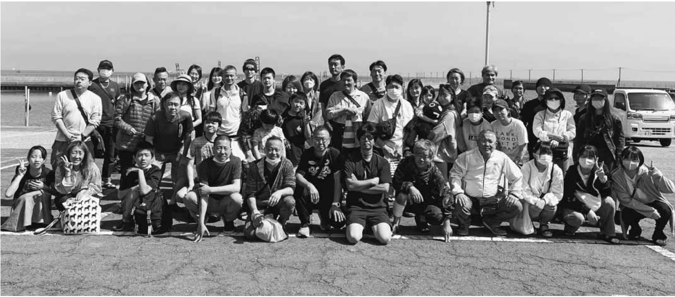
久しぶりのレクで大勢の参加者が集まりました