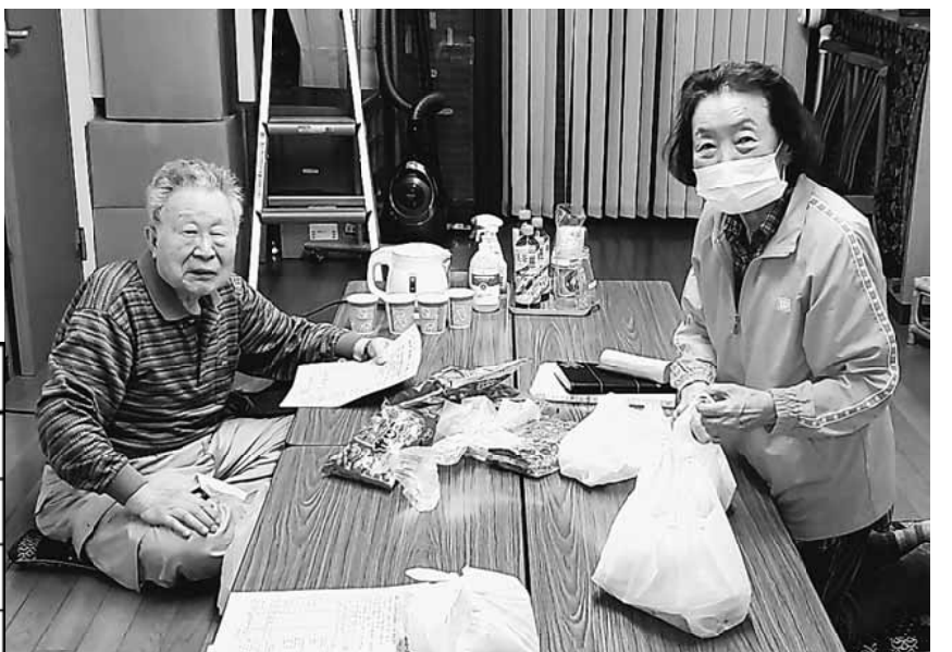
最後まで諦めず粘りました

75 常に安全第一を目指し、先輩方にご指導いただきながら日々仕事に取り組んでいます。 趣味はサッカーで休日は観戦をしたり、見るだけではなく自分でもサッカーをしたりして過ごしています。