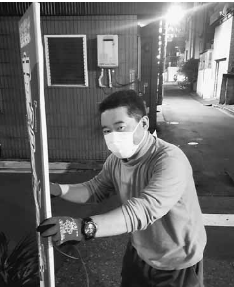
大橋前後継者対策部長も各分会に入って協力してくれました