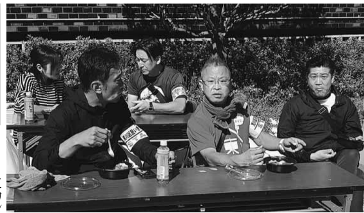
しっかり食べて午後にも備えます

今年の方針通りに行い包丁の受け渡しミスなども無く、問題なく終えることが出来ました。今年度は初の試みとしてスタンブリーを開催、またキッチンカーを配置しました。お昼ごろには多くのお客様が並び大盛況でした。荒川支部からは組合員(書記局・来賓除く・家族併せて131人が(2019年1599人が参加しました。4年ぶりの開催でしたが皆さんのおかげで荒川区民いきいきまつりを無事開催することが出来ました。ご協力ありがとうございました。