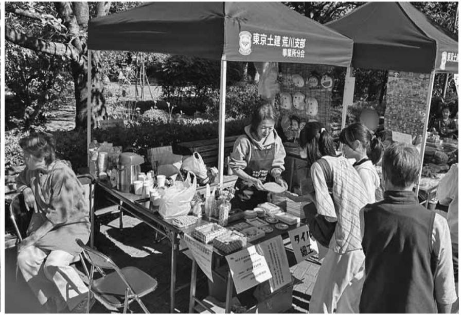
事業所分会のタイル細工は親子に大人気でした

【仕事対策部発】10月22日に第29回荒川区民いきいきまつりを区立荒川公園にて荒川区、荒川区社会福祉協議会、荒川区教育委員会の後援を受け、区内共闘団体東京ほくと医療生協、荒川生協、汐入診療所、新婦人荒川支部と共同で開催しました。当日は大候にも恵まれ約2000人ももの来場者がありました。4年ぶりの開催という事で包丁研ぎを心待ちにしていた方々は受付開始前の9時過ぎごろから行列ができ、開始1時間程で上限の200本に達し終了しました。ま