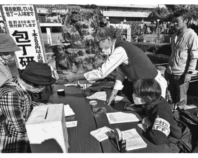
お客さんが殺到した包丁研ぎ(上・下)