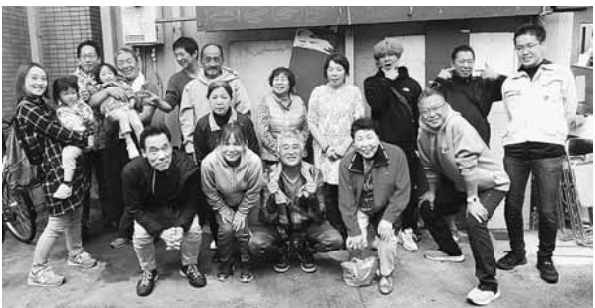
たくさんの仲間が集まりました

分会役員、活動家の皆さん、2ヶ月間に渡る秋の拡大月間お疲れ様でした。皆さんのご尽力のお陰で7年ぶりに秋の拡大目標達成することが出来ました。本当にありがとうございます御座います。66人の目標に対して71人