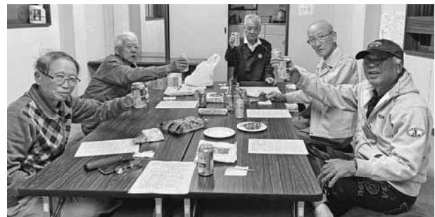
分会目標達成を祝して乾杯