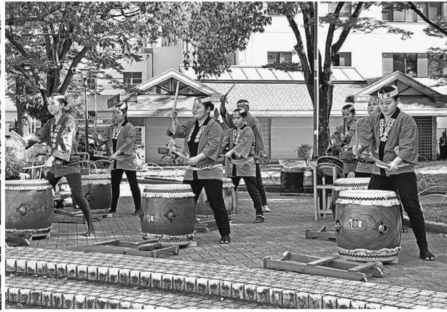
迫力ある南千住2丁目青年太鼓のパフォーマンスの様子