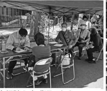
住宅相談も大盛況でした