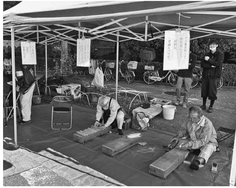
南千住分会は青森ひばを使用した箸づくりを開催しました