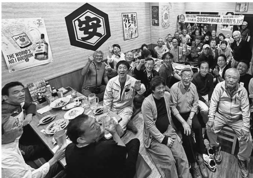
お店を貸し切り達成を祝いました

組織増勢、要求実現の為に、9月から10月にかけて全13日間の拡大行動日を設定して拡大に取り組みました。荒川支部は1月1日現勢の3・5%の拡大を目指し66人を支部目標として秋の拡大月間に取り組みました。秋の拡大では71人の新たな仲間を迎え入れ、11月1日現勢は1862人となりました。