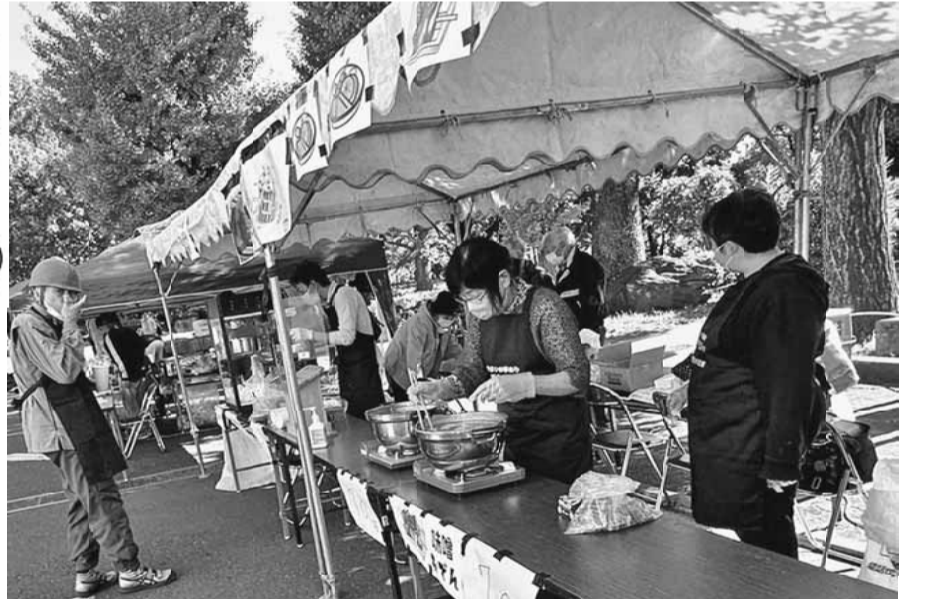
あったかい味噌おでんが盛況の日暮里2分会

【細谷清江通信員 日暮里2分会】コロナ禍で3年間、開催を見送っていたいきいきまつりでしたが、コロナ感染症がうらみに移行されたことで今年も開催しました。3年間待っていたこともあり、組合員さんも準備する大事なことを忘れていたり、思い出せないことも多くいざ皆で役割分担などを話し合うとなかなか前に進まず、開催する前からドタバタ劇場となりました。私たちが支部も歳を重ね、今までできていたことが中々思うようにいかず、若い人に頼りたいところも若い人への継承がうまくいっていない。こういった催事でまじまじと実感させられました。それでも当日は建設従事者の存在意義を区民に周知するため、有志が集まってくれた仲間での催しを滞りなく終えることができました。3年前なので定かではありませんが来場者も少し3年前よりは少なかったように思いました。また仲間と楽しく元気に活動するために、総括の中でしっかりと来年度の開催に向けて準備していきましよう。分会の皆さまも役員として役割を背負ってくれた皆さまも本当にお疲れ様でした。