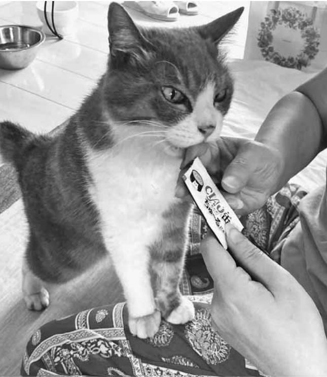
ちゅ〜るに夢中なフーちゃん

飼っていたせいか家族がみんな可愛がるので毎日来るようになり、家の前で寝るようになりまし 寒い日はかわいそうに思い、玄関に入れてあげたり倉庫の段ボールで寒さをしのがせてあげたりと面倒を見ていました。段々と猫も態度がわがままになり、外から鳴いて呼ぶようになりました。夜中に呼ばれるのが困ります。