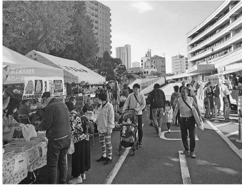
子供からお年寄りまでたくさんの来場者で賑わっていました