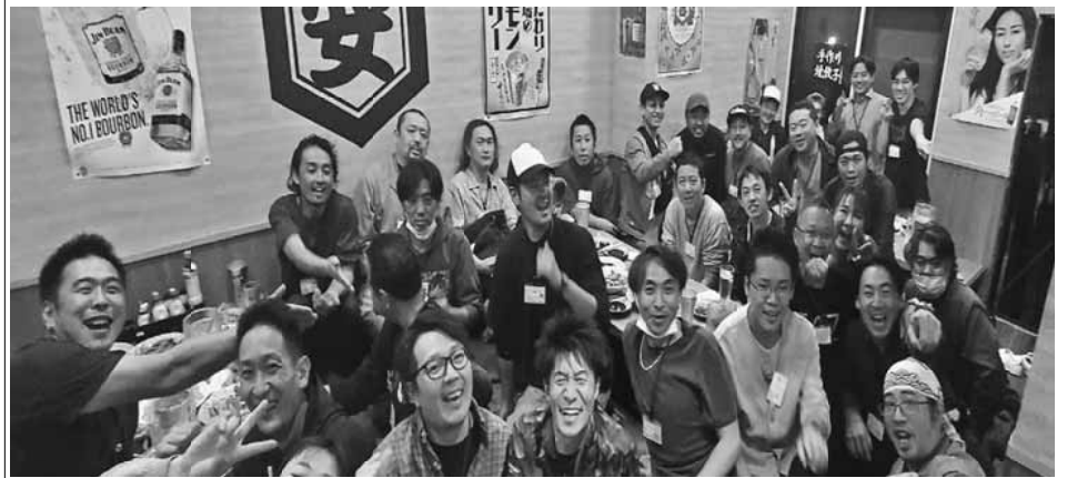
多くの仲間が集い盛り上がりを見せました

【後継者対策部 発】10月28日(土)、後継者対策部主催の懇親会を町屋駅近くの「大衆食堂安ざわ」で開催しました。 全体で38人(後継者対策部員・書記含む)が参加しました。 19時から22時までの食べ飲みおかわりし放題で、久々の懇親会ということもあり大いに盛り上がりま