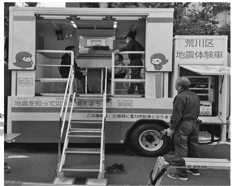
大人から子供まで多くの方が体験した地震車

【石田美好通信員 南千住分会】4年ぶりに開催した区民まつりに、南千住分会からは支部員を含めて20人の仲間が参加しました。今年はいちご作り、バザー、古本販売、くじ引きの4本立ての企画を行いました。特に人気だったいちご作りには、子供から大人まで多くのお客様が集まり、真剣に取り組みつつも楽しんでる様子がかがえしました。中には削った際に出る「おがくず」を爆製チップにするので持ち帰りたいと希望する方もいて、その方にはお土産として渡しました。仲間からは「久々で疲れたが楽しかった」といった声があがり和気あいあいとした雰囲気のまま閉会を迎えました。今年も天気が良く、参加してくれた事業所の若手や主婦の皆さんと共に協力して取り組み、分会としても成功した区民まつりとなりました。