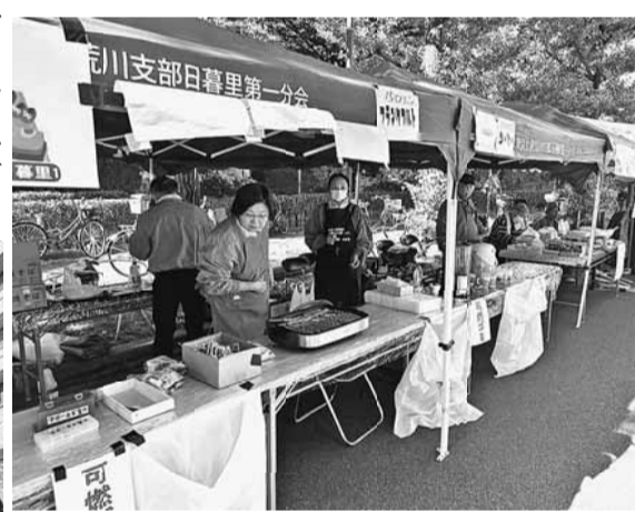
良い香りが漂う日暮里1分会