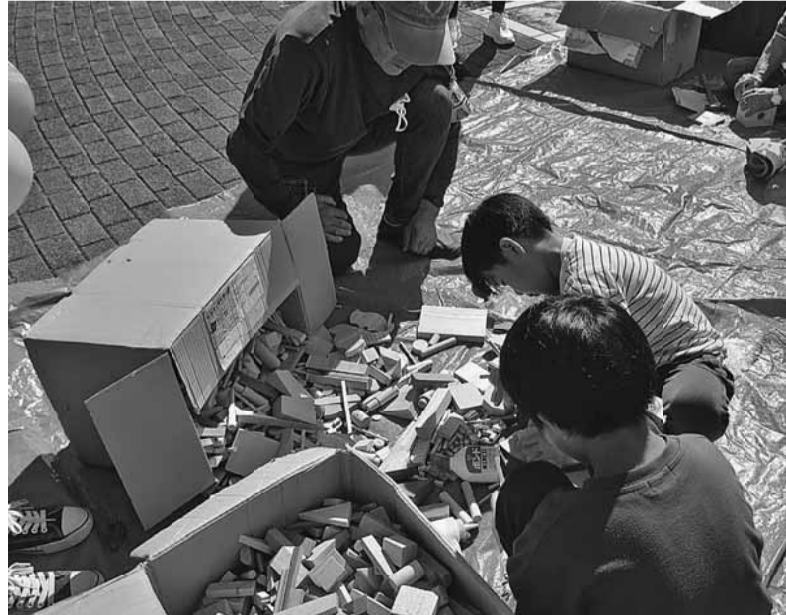
多種多様な組み合わせを楽しむ人気コーナーのコッパティ

【細谷清江通信員 日暮里2分会】コロナ禍で3年間、開催を見送っていたいきいきまつりでしたが、コロナ感染症がうらみに移行されたことで今年も開催しました。3年間待っていたこともあり、組合員さんも準備する大事なことを忘れていたり、思い出せないことも多くいざ皆で役割分担などを話し合うとなかなか前に進まず、開催する前からドタバタ劇場となりました。私たちが支部も歳を重ね、今までできていたことが中々思うようにいかず、若い人に頼りたいところも若い人への継承がうまくいっていない。こういった催事でまじまじと実感させられました。それでも当日は建設従事者の存在意義を区民に周知するため、有志が集まってくれた仲間での催しを滞りなく終えることができました。3年前なので定かではありませんが来場者も少し3年前よりは少なかったように思いました。また仲間と楽しく元気に活動するために、総括の中でしっかりと来年度の開催に向けて準備していきましよう。分会の皆さまも役員として役割を背負ってくれた皆さまも本当にお疲れ様でした。