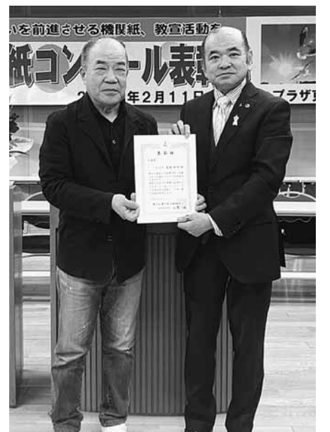
1年越しの受賞です

たく鳥の躍動感が素晴らしく、組合の活動にも元気を与えてくれる作品だと感じました。