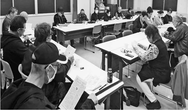
多くのベテランの仲間が集まる荒川分会