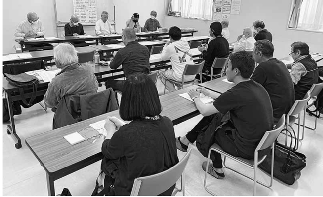
若い人の参加も多い南千住分会