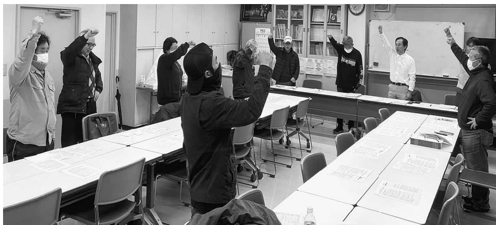
団結ガンパローで意思統一する町屋南分会