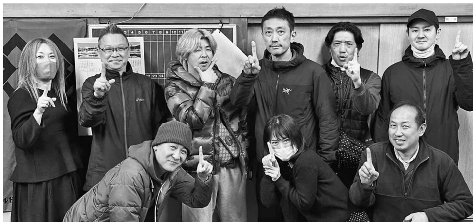
拡大に向けやる気をみせる東尾久1分会