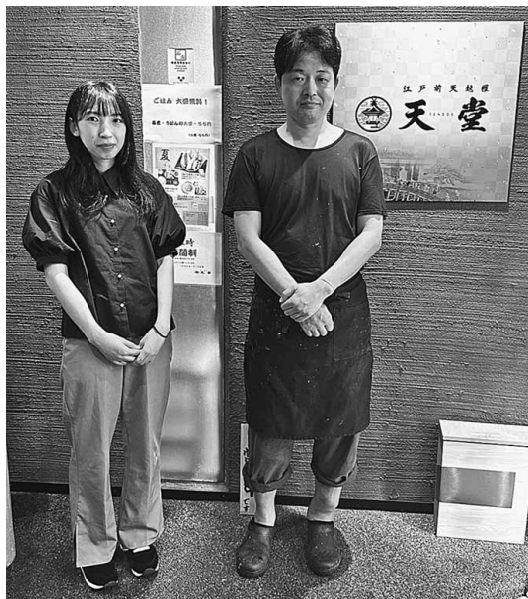
たくさんのご来店お待ちしております