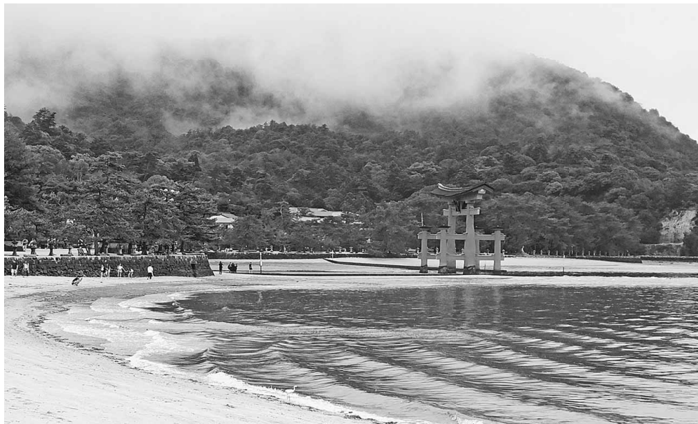
荘厳な風景に圧巻されました

皆さんもご存じだと思 いますが、組合に加入 すると入院給付やお 祝い金、慶弔金など は、対象になります が、仲間を支える「ど けん共済」は他にもた くさんあります。それ らに加入することで、 災害などにも対応でき るようになるので、安 心して暮らしていける ようになります。 使ったことのない方 は、是非組合の共済制 度を有効活用してくだ さい。