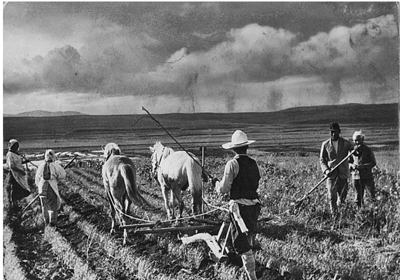
水曲郷開拓団の作業風景

農地で作物を作り、家で蚕 を育てて養蚕もしていま す。所帯を持ち、小学生の 子ども2人、姉と弟の兄弟 です。しかし、夫婦で一生 懸命働いても生活は楽では ありません。食っていくの がやっと。子どもたちにお 腹いっぱい食べさせてあげ ることなど、もちろん出来 ません。それでも、この時 代は日本のために、皆が苦 勞して、我慢する時代だっ たので、不満を口に出すこ とも許されませんでした。 当時、日本は富国強兵、 日清・日露戦争に勝利し、 世界の帝国主義国の仲間入 りを果たし、韓国も併合し て大陸進出を狙っています。 朝鮮半島の付け根の付