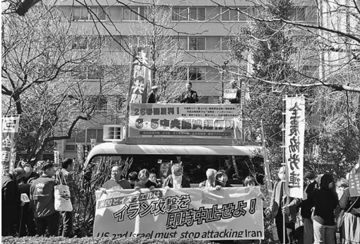
宣伝カーの上から訴えがおこなわれました