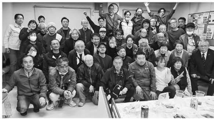
2026年春 出陣式の様子

この月間の目標64人を皆の力で「対話を広げ仲間を増やそう!」を実現して、なんとでも達成しようではありませんか。