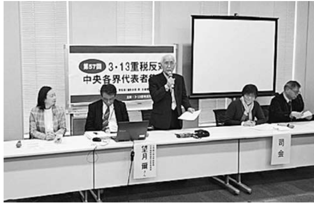
あいさつする各界連代表

2議員会館で開催された「重税反対中央各界代表者集会」に参加しました。代表者あいさつで、インフレによる実質賃金の低迷や消費税負担に苦しむ中小業者の現状を訴えがありました。