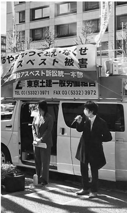
東京地裁前で訴え

この訴訟は建材メーカーにより、アスベスト被害に見舞われた全ての被害者と遺族への謝罪と補償を要求