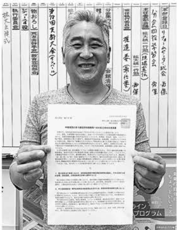
要請書提出しました

断熱材、防水材、塗料など多くの資材で価格改定や受注制限、生産停止などが相次いでおり、現場では「材料が入らず工期が読めない」「見積ができない」などといった深刻な声が多く聞かれています。